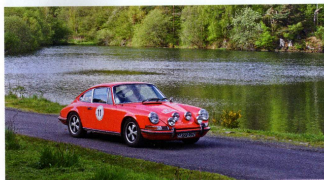
Cette difficile édition a été remportée en Expert par David et Arnaud Castera (Porsche 911 E).

A nouveau une pause goûter sous un soleil presque retrouvé, avant un retour à travers des paysages de l'Artense où alternent