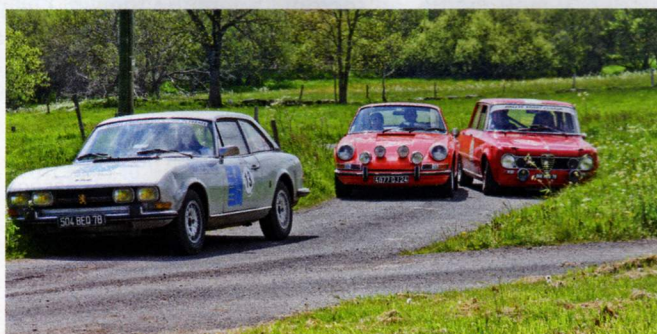
Il y a comme de l'hésitation dans l'air ...